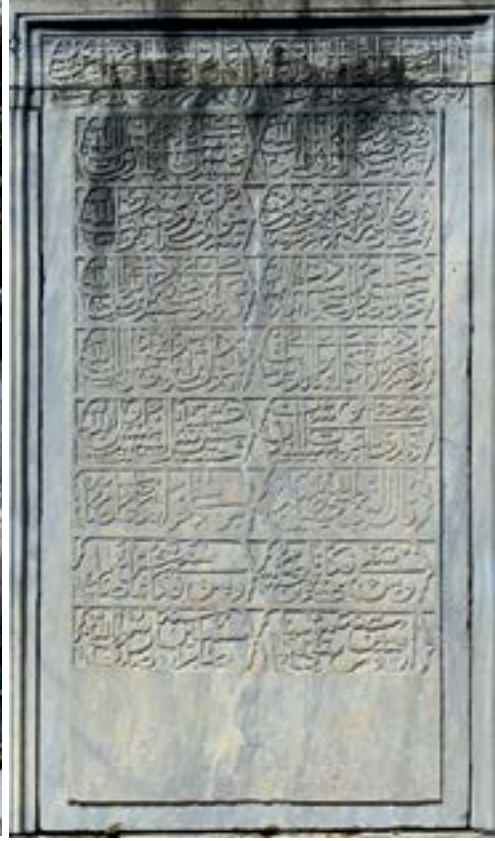
Caminin sebil kuyusu ve kitabesi