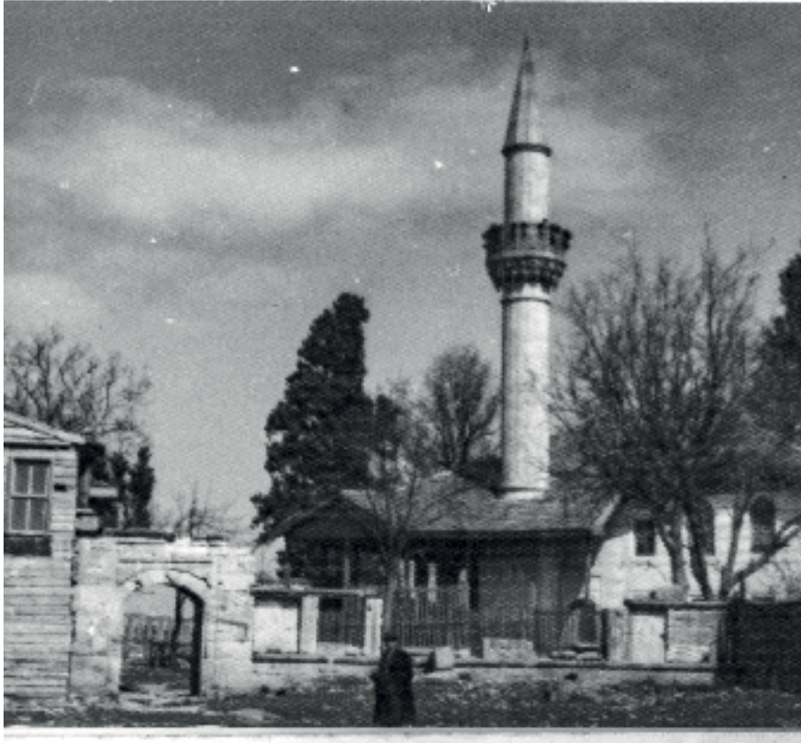
Arakiyeci İbrahim Ağa Camii

T op Kapısı ya da Doğu Roma İmparatorluğu'ndaki 1 adıyla Romanos Kapısı, surlarla çevrili İstanbul'un sabah açılıp akşam kapanan 55 kapısından biridir; ancak bizim için özel bir önemi vardır: Fatih Sultan Mehmed (hd: 1451-1481), İstanbul'u kuşattığında karargâhını ve Macar Urban'ın Edirne'de döktüğü "büyük top"u Top Kapısı önünde konuşlandırmıştır. Bu büyük topun fetih mucizesindeki rolü tartışmalıdır ama Osmanlı ordusunun motivasyonu açısından yararlı olduğu kuşkusuzdur. 2 En ağır top atışları da buradan yapılmıştır. Öyle ki sonrasında buradaki mahallenin adı "Top Yıkığı mahallesi" olmuştur.