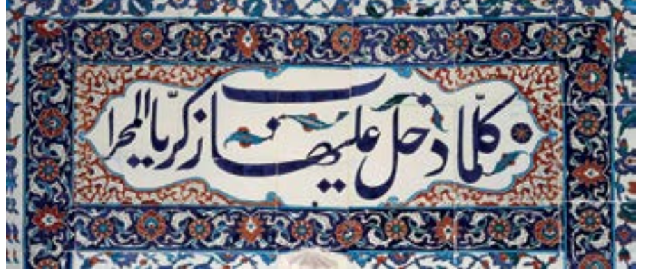
Arakiyeci İbrahim Ağa Camii mihrap kitabesi