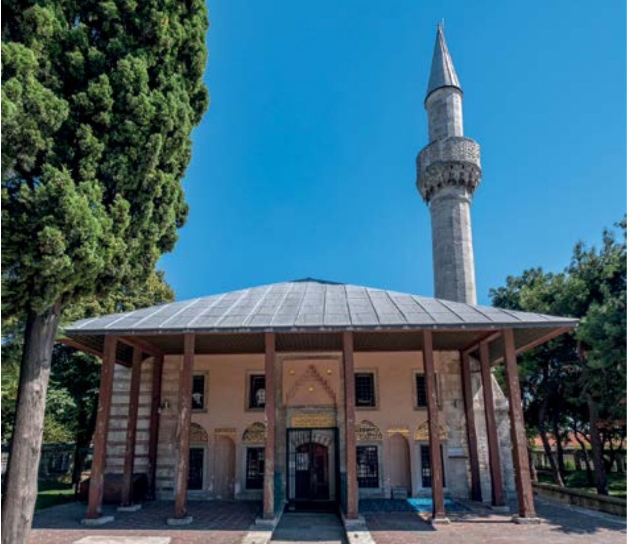
Arakiyeci İbrahim Ağa Camii restorasyon sonrası

Topkapı Sarayı ile sözü edilen Top Kapısı arasında herhangi bir ilişki söz konusu değildir. Aslında Fatih'in yaptırdığı yeni sarayın adı Saray-ı Cedid-i Amire (Yeni Devlet Sarayı) idi. Buraya açılan "Ayia Barbara Kapısı"na sarayı korumak için yerleştirilen toplar, zamanla yeni sarayın Topkapı Sarayı olarak anılmasına neden olmuştur.